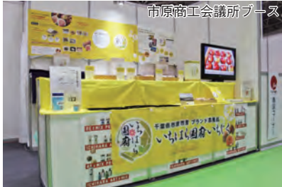
市原商工会議所ブース

ネット販売や催事の出品の依頼など、バイヤーの方から話を頂いたほか、一般の方にも足を運んで頂き、どこで買えますか？などたくさんのお問い合わせを頂きました。県外の方も手軽に購入できる流通体制の構築が課題となります。そのため、平成28年度は流通モデルの実証事業を実施します。初日にはNHKのニュースにも取りあげられ、各メーカーとも反響の大きさに驚きました。