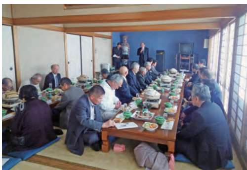
始賑やかな新年会となりました。