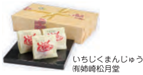
いちじくまんじゅう 衛姉崎松月堂

ネット販売や催事の出品の依頼など、バイヤーの方から話を頂いたほか、一般の方にも足を運んで頂き、どこで買えますか？などたくさんのお問い合わせを頂きました。県外の方も手軽に購入できる流通体制の構築が課題となります。そのため、平成28年度は流通モデルの実証事業を実施します。初日にはNHKのニュースにも取りあげられ、各メーカーとも反響の大きさに驚きました。