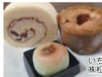
いちじくマフィン 株松月堂本店