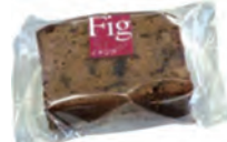
国府いちじくの パウンドケーキ 衛吾妻堂