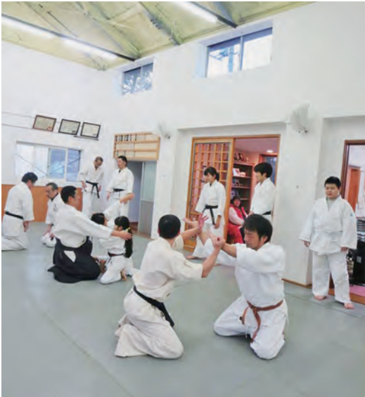
改装後の道場での稽古

なかったため、猛暑や酷寒などの気候に左右され、通年快適な環境を提供できないことでした。生涯スポーツとして合気道の普及を目指