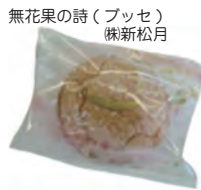
無花果の詩(フッセ) 株新松月